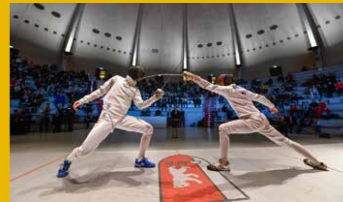
Historischer Kuppelsaal (Galafinale) Haus des Deutschen Sports im Olympiapark Berlin Hanns-Braun-Straße / Adlerplatz 14053 Berlin